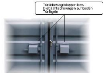
Türsicherungsklappen bzw. Diebstahlsicherungen auf beiden Türflügeln