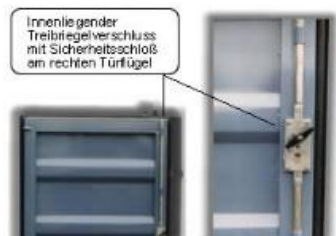
Innenliegender Treibriegelverschluss mit Sicherheitsschloss am rechten Türflügel